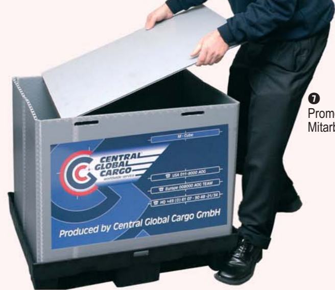
7 Verpackungsbeschriftung E, G, I