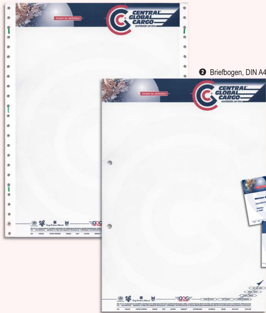
2 Briefbogen, DIN A4