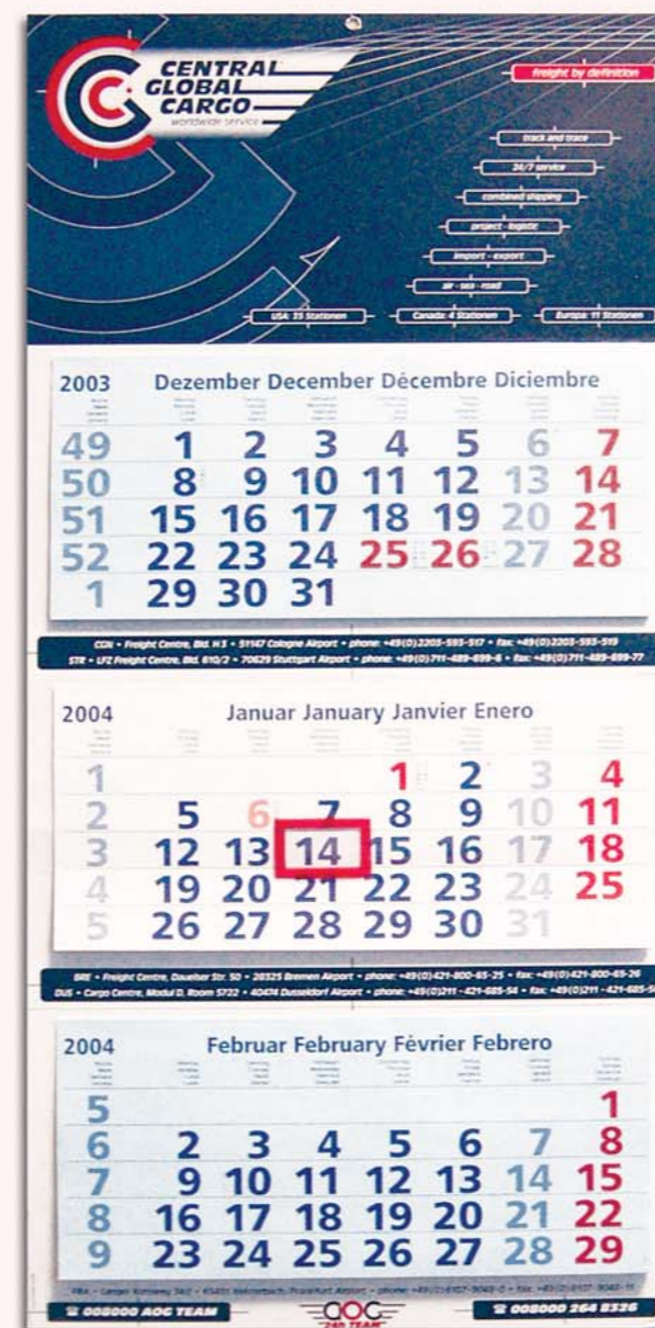
3 Wandkalender, 3 Monate E, G, I