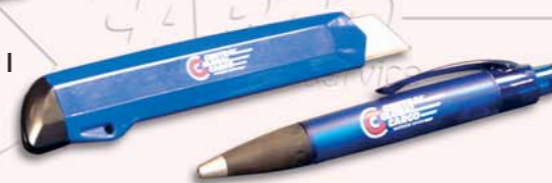
6 Cutter, Kugelschreiber E, G, I