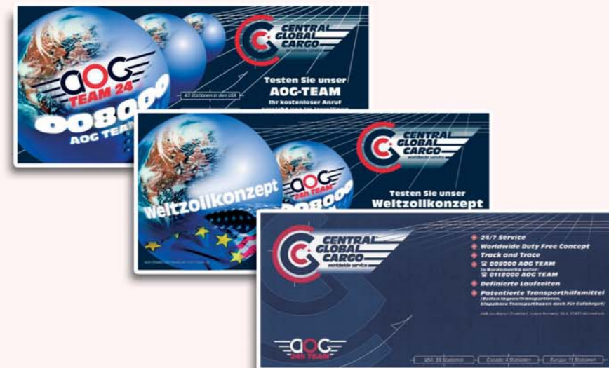
5 Werbeanzeigen, diverse Fachtitel E