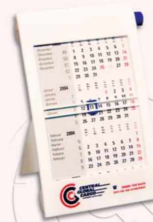
6 Tischstellkalender E, G, I